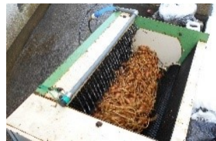
糖度が30度を超えて一次洗浄