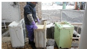
2槽式洗濯機での2次洗浄