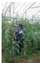
こんなに植えてこれだけ成ってます