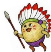
アピオス イメージキャラクター 「アピオスポーイ」