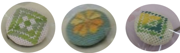
こぎん刺しのブローチ