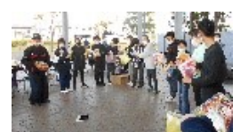
こんなに沢山の景品