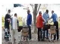
皆のバーベキュー作り