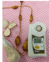
寒ざらしをした後の糖度測定