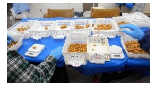
ツル切りをしてサイズ分け